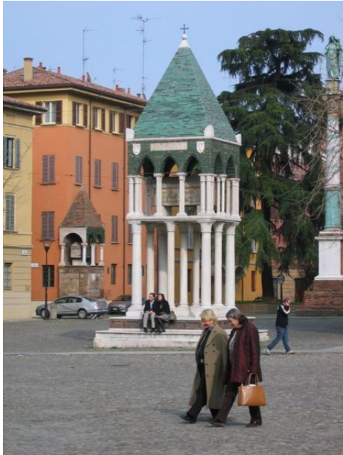
fig. 1: Arca di Rolandino de Passeggeri (piazza San Domenico)