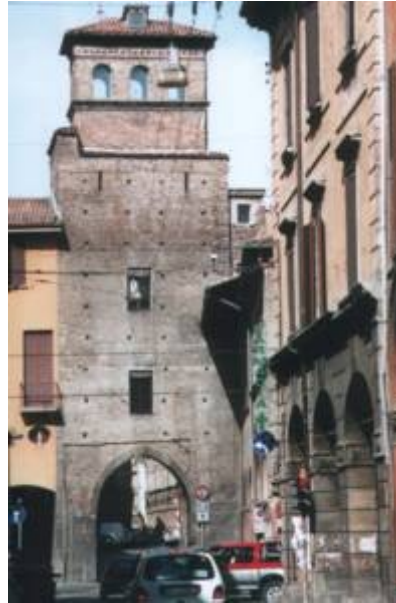
fig. 2: il torresotto di strada S. Vitale