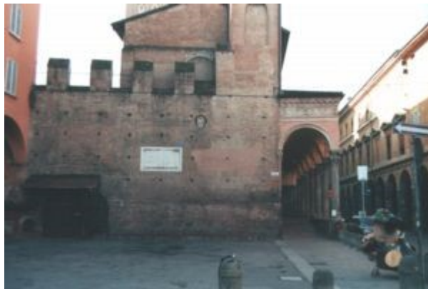
fig. 4: un tratto della cerchia dei Torresotti presso Piazza Verdi